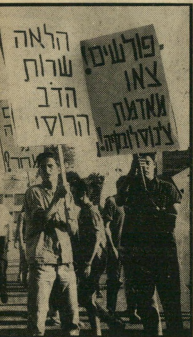
סטודנטים מפגנים בתל-אביב החרות — אחת היא