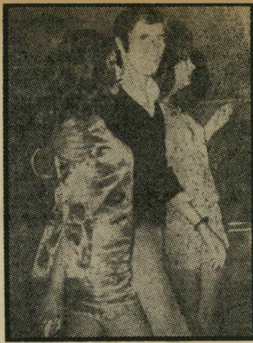
ב.ב. וירידה החדש