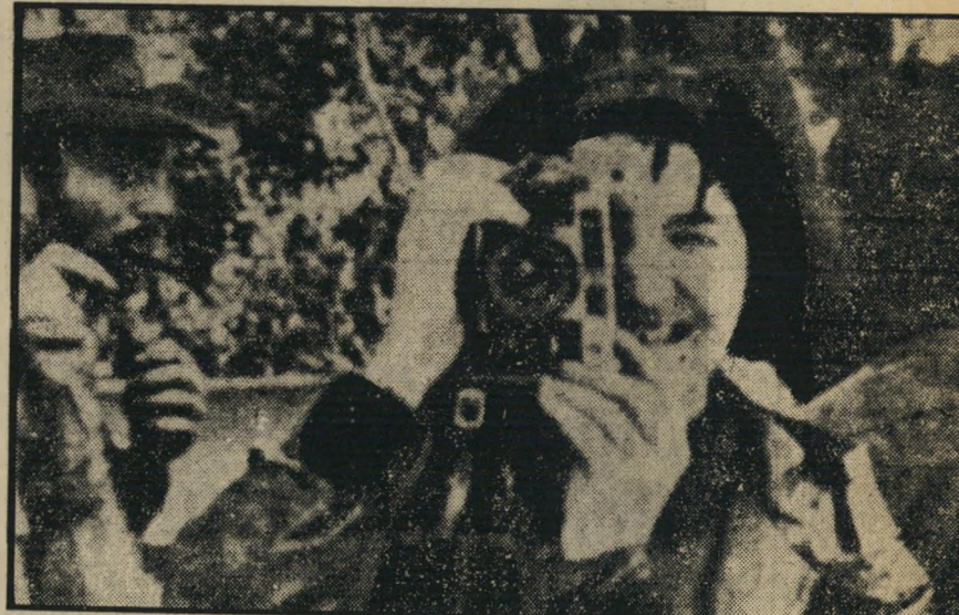
תניה (מצלמת) במעוז הפרטיזנים אהבה עזה כמוות

הצבי יהודיה , המרגלת הרוסית וי לוחמת-הגרילה הדרום-אמריקאית תניה נולדה לפני 32 שנה לאם יהודית ממוצא פולני ולאב גרמני-קומוניסטי. אביה היגר עוד קודם לכן לארגנטינה. כך שכאשר נולדה בתו, קרא הלוחם הוותיק לבתו הידוי תמרה בורקה.