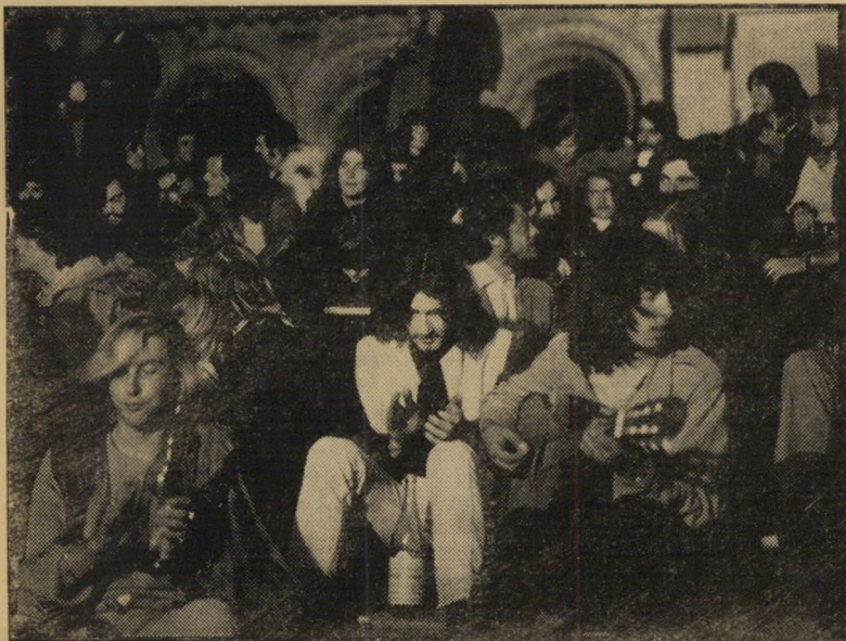
"היפים" כפארים ב"הזאבים הצעירים" איפה הוא, איפה?

פגשתו בצעונים מאושרים (אסתר, חל'אביב) מתאר בעוצמה וברגש את חייהם,