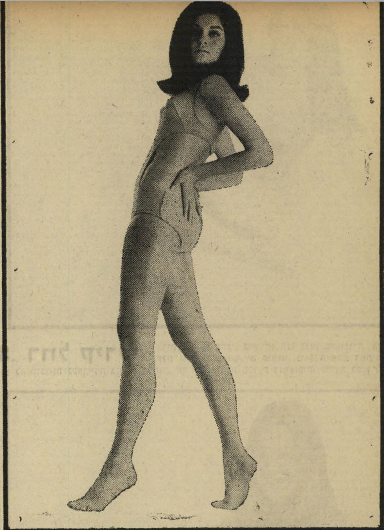
13. שרה גורן מסיימת השבוע את הטירונות שלה. היא בת 18, ולפני גיוסה עבדה כמזכירת גיזבר ההסתדרות. הספיקה להור פיע גם כדוגמנית, לעיתים מזומנות. בחודש שעבר זכתה בתואר "סגנית מלכת היופי".