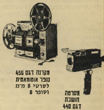
מקרנה דגם 456 סוכר אומואסית לסרטי 8 מ"מ וסופר 8