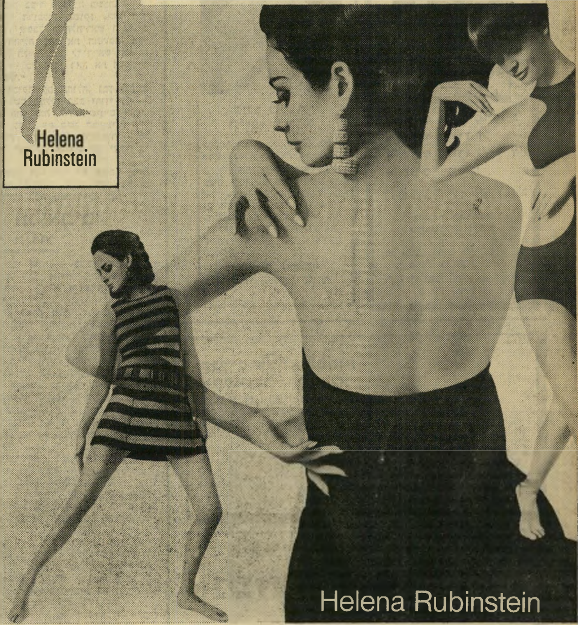
שחם לכינסון אילון

יעוץ קוסמטי חינם במרכז ההדרכה, שדרות קק"ל 94 תל-אביב, בימי שני ורביעי, בין 6.00-3.30 אחה"צ.