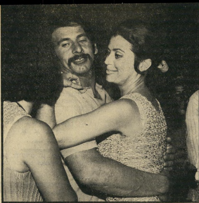
...עם שפיריה כיוזכאי במקום לחיצת ידיים