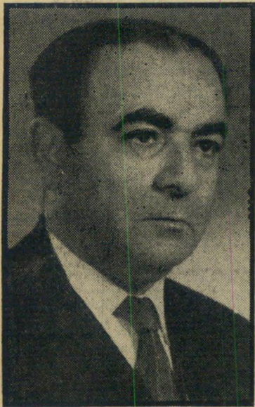
עו"ד שחאדה מאבק עיקרי

ב אריקאדות על חודש מאי לא הורקמו למען תביעות-שכר. הן הוקמו ל מען יסולק המישטר הישן. למען ילך לו דה-גול. הן קמו כדי שיחוסל, אחת לתמיד, המימסד המנופח והמדכא של הרפובליקה החמישית. ממש מאותה סיבה שקמו קודם לכן הבאריקאדות של דוטשקה בברמניה. וכמו שם, גם כאן, הוליד מרד-הנעורים