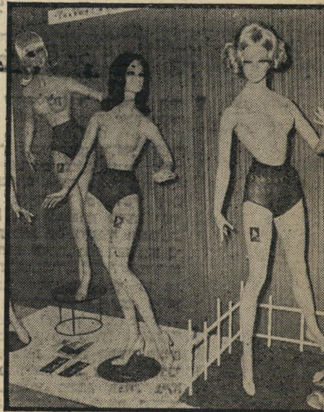
דוכן התחנותים צניעות מכאנית

למשטרה לא יעזור שום דבר. אנשים ממ-שכים לבוא אלי, ומשלמים לי כסף. המול שלי — שאין לי סרטור. לכן כל הכסף הולך אלי. אני נונתת לחבר שלי רק איוה 20 לירות ליום."