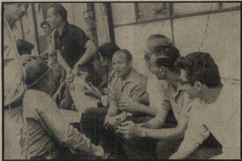
שוכתי מלמשת חוצ'נר „אני אוהב לשבור!“