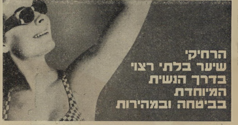
מוצר דיסקו בעים חיפה

הרחיקי שיער בלתי רצוי בדרך הנשית המיוחדת בביטחה ובמהירות