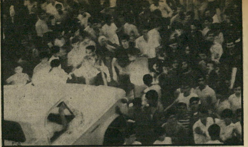
הפגנת הנקם בשכונת שפירא "נחפש אותו מבית לביתו"