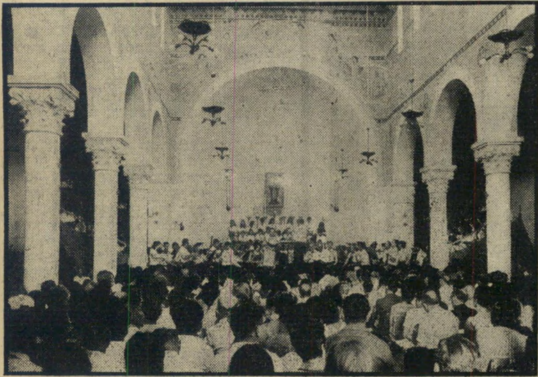
"הפאסיון על-פי מתיאוס" ככנסית אברוגוש "אליו אליו למה עזבתני?"

היו שהסתייגו מבחירה זו. לא רק מפני שהיצירה בוצעה במקורה הגרמני, ולא רק בגלל אופייה הדתי המובהק, אלא גם מפני שקיטעי הברית החדשה, השזורים בה, הם בעלי אופי אנטי-יהודי מובהק. "אז מה?" שאל קיבוניק צעיר, אחד מבני-הנוער שהיו את הרוב בפסטיבל, "בשביל זה באנו לארץ, שנוכל להרשות לעצמנו יצירות כאלו. אנו די חזקים לזה." שני צדדי המטבע. לדוב באי הפסטיבל, לא התעוררה הבעיה כלל. בש' כילם היתה המוסיקה העיקר — המוסיקה