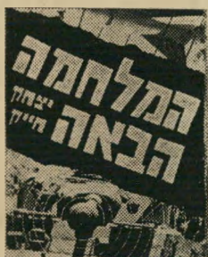
הוצאת "רמדור" בע"מ. פורמט ספר-כיס, מפות, "תצלומים". מודפס על נייר לבן. המחיר 3 ל"י.