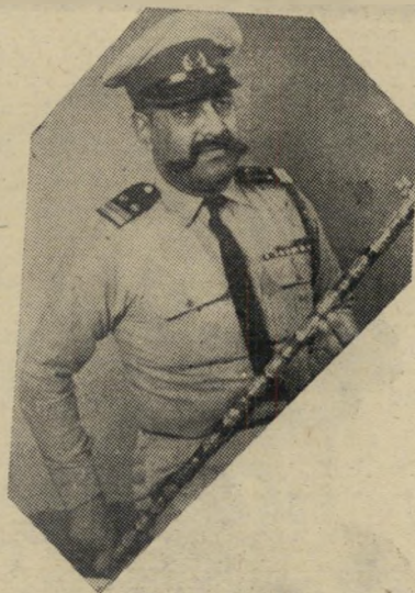
מוכס ג'מילי הן יודעות מדוע

רס"ר, כדבריו; ובין התקופות הארוכות בהן הוא ניקרא לשירות מילואים ממושך ומיוחד — משעמם לו. את שעות הבוקר הוא מבלה במשרד האוצר, כקצין חקירות למניעת הברחות. שם עוד מבינים קצת מהי סמכות אמיתית. אבל אחר-הצהריים — באמת, איך ממלאים את הזמן אחרי שעות העבודה? הפיתרון שמצא גימני, אב לשתי בנות בוגרות, ובעל לאשה ממנה ניפרד לפני שלוש שנים — אפשר שאיננו הכי אורגינאלי בעולם אבל הוא בכל זאת משהו. כי גימני עוסק — בשיטות צבאיות ממש ומתוך דקות נעלה במטרה — בחתיכות. מכל הסוגים, מכל הצבעים — העיקר שהן