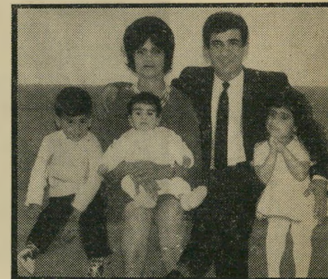
קיפסאי כחזון ומשפחתו "זה החיים שלי"

מוות לעזי היהודיה. 28 אלף עינים יש בארץ - נקודות, ברודות, ושופעות- חלב. אלה הן פרותיו של האיש הקטן. ומלחמה עזה נטושה בין העזי היהודיה, המ- טופחת, לבין יריבתה הערבית, הרועה-פרא. העזי היהודיה אוכלת מיספוא תוצרת-חורף, מניבה חלב פי ארבע, ואינה פוגעת בשי- דות. העזי הערבית היא שחורה בצבעה, נר-