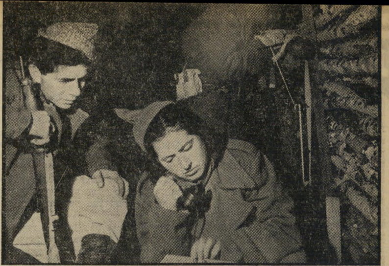
לוחמי תש"ח * המחיר היה עצום

מירוק-הטילים במרחב נפתח רשמית עון בשנת 1961, כאשר ישראל שילחה