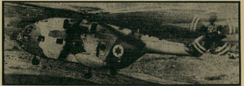
מסוק "סופר-פרלון" ס"א/321

עדין נרעשת ונרגשת אני בעיקבות שיהיה לי עם ערבי ישראלי צעיר — איש גדול-מידות וחושב, שאיכפת לו כל הנעשה מסביבו. לא אוכל לפרסם את שמו: חלילה לי מלסכך אותו בצרות.