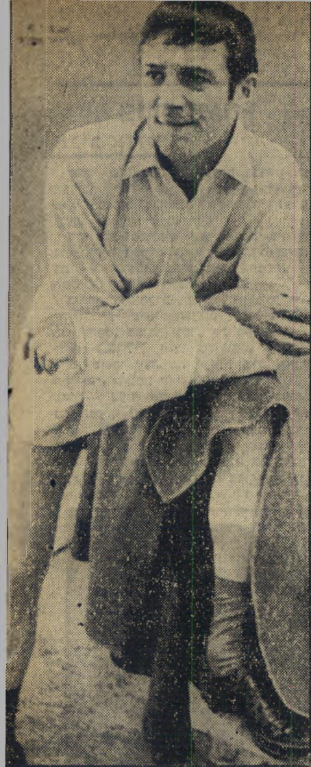
סמדימשתרה ברגס במעצר נשק מותר, ירק אסור

בדקאר לא רק בפסיכיאטריה לשמה — אלא גם בסוציולוגיה, בפסיכולוגיה כללית, באתנולוגיה ובידיע-השפות. "נוציא מן הכנס הזה יסודות חדישים לטיפול בחוליה-הנפש", הצהיר אחד הרופאים בתום הכנס. "כבר השגנו עשרות השגות."