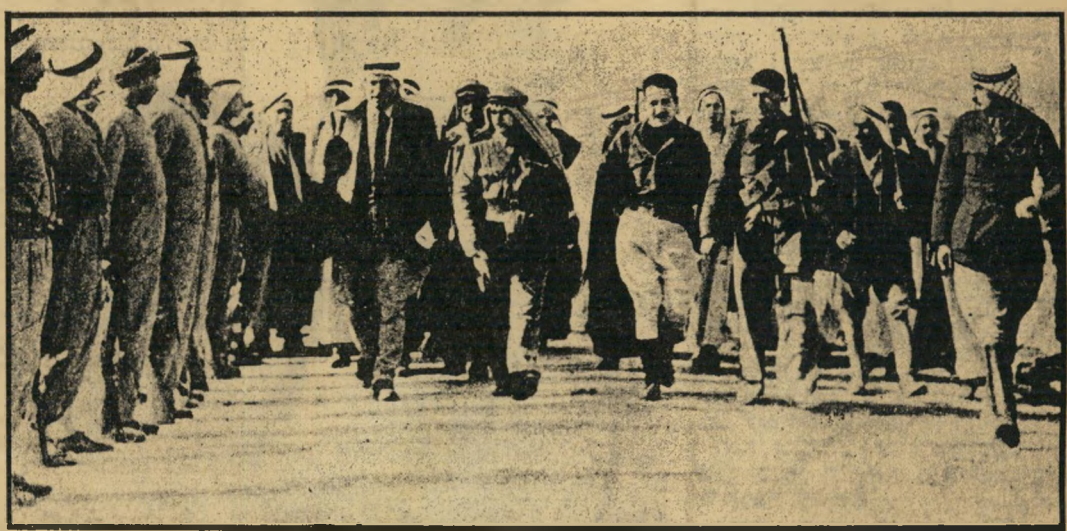
חובש כפיה, במרכז, שנהרג בקרב על הקאסטל הקבור ב־חצר מיסג אל־אקצה בירושלים. הוא הפיח ביאסר הצעיר רוח צבאית, שדחפה אותו עד שהגיעו בעצמו למעמד מפקד.

★ ★ ★ הרי מדהמת־ששת־הימים, נראה יאסר ערפאת בשכם ובירושלים המיוזרחת. אבל איש לא מסר אותו לשלטונות הישראליים, והוא שב לגדה המיוזרחת, שהפכה להיות בסיסו העיקרי של אל־פתח. הוא הקים את מטהו ב־כפר כראמה, התהלך גם בעמאן ללא פחד משלטונות־ירדן. אבו־עאמר הצליח להימלט מכראמה, דקות אחדות לפני שנחתו שם הצנחנים הישראליים. למחרת, היו הוא ואנשיו גיבורי העולם הערבי כולו, הפכו סכנה בלתי־מוסמית לשל־טונו של חוסיין. עד כדירכך, שרבים החלו שואלים את עצמם: מתי יבצע אל־פתח הפיכה בירדן, ויקים שם רפובלי־קה פלסטינית? מיברק מנשיא אלג'יריה, הוארי בומדיין, הזמין את ער־פאת לאלג'יר. התוצאה: הודעה כי אל־פתח ינקוט להבא ב־שיטות־פעולה חדשות. במקום פגיעות לאורך ביקעת־הירדן, יתבססו מעתה חוליות אל־פתח בעומק השטח הישראלי. תוצאה שנייה: מייסד אל־פתח ומפקדו יצא מאלמוניותו המחתרית. הודעה רשמית מסרה, כי מעתה ייצג יאסר ערפאת את האירגון כלפי חוץ.