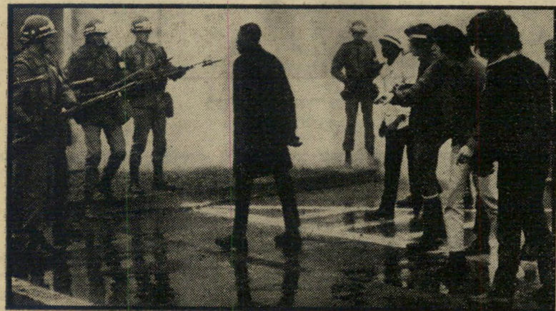
חיילים מתאמנים בדיכוי מהומות* צבא פרטי

בתנאים אנושיים, ופיצוי מלא יינתן לאלה שכתיבה ייהרסו. אלא שבתחום אחר לא השיגו הכושים של ניווארק אלא צרות. כתוצאה מן הקרב, התארגנו גם הלבנים בעיר זו — ובעיקר הלבנים הנבערים והקיצוניים ביותר. בראשם עומד כיום קבלן בשם אנטוני אימפריאלה, שאירגן גוף המתכנה סיירי הג'ונגל. לגוף זה צבא פרטי בעל אלף רובים, שיריונית וחמישה הליקופטרים. "נהדרף כל פלישה, כמו בג'ונגל!" מתפאר הקבלן הקיצוני. "האיטלקים המזופתים" . מולו עוי מד אירגון הכוח השחור, המצייד אף הוא את תושבי-הג'ונגל-השחורים בנשק, מחלק עתה כרוז שכותרתו: "האיטלקים המזופתים רוצים במלחמה". השבוע, הגיעו שתי הסיעות הקיצוניות ל- עימות, כשנציגיהן נוכחו בין הקהל, בעת ישיבת מועצת-העיר. מול אימפריאלה הת- ייצב איש ידוע יותר: המחואי הכושי לרוא (ההולנדי) ג'ונס, מי שנעצר הקיץ בעוון החוקת אקדחים. לרגע נירמה היה שהאביב החם של ניו- ווארק עומד להתלהט. אבל כעבור רגע הכל נרגע. בניווארק השאירו את המלאכה לתר- שבי ממפיס הרומית.