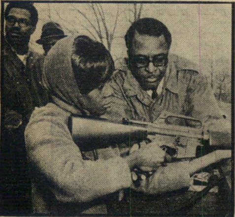
כושית מתאמת ברובה סיירי הג'ונגל מוכנים

השבוע השיגו הכושים את מבוקשם: ה' קאמפוס יוקם על שטח מצומצם יותר,