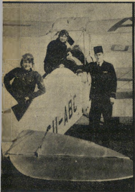
טייסים ישראליים במצריים ”נלחם ביחד -- בלהק אחד!”

„קורס בארץ הנילוס!“ שולמית הורנהורט איננה בארץ. מסתבר, שהיא נישאה