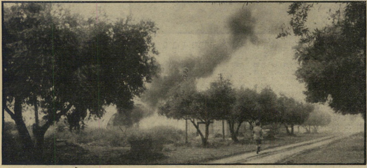
נף בספר הירדן 1968: קיבוץ מסדה בעת ההפגזה בראש הרשימה, במיסגרת שחורה

טוב ליהודים או רע ליהודים? זאת היתה השאלה הראשונה, כאשר נתקבלה הידיעה המהממת על החלטת הנשיא לינדון ג'ונסון שלא להציג את מועמדותו שנית לנשיאות ארצות-הברית. התשובה: בסך הכל, זה טוב. אומנם, ג'ונסון נחשב לתומך מושבע של מדיניות ממשלת-ישראל, והוא נתן לה גי” בוי מירבי בעת מלחמת-ששת-הימים ואח” ריה. אפשר היה לצפות ממנו, בוודאות, כי יתן לישראל את כל הגבוי הדרוש לה — ערבי-הבחירות, כאשר הקולות היתה דיים יכלו להכריע לגבי בחירתו, שסיכוייה הסכו מופסקים. החשש לגבי ג'ונסון המייחס דווקא לתק” קופה שלאחר הבחירות. אפשר לזלזל. כי לפי חוקת ארצות-