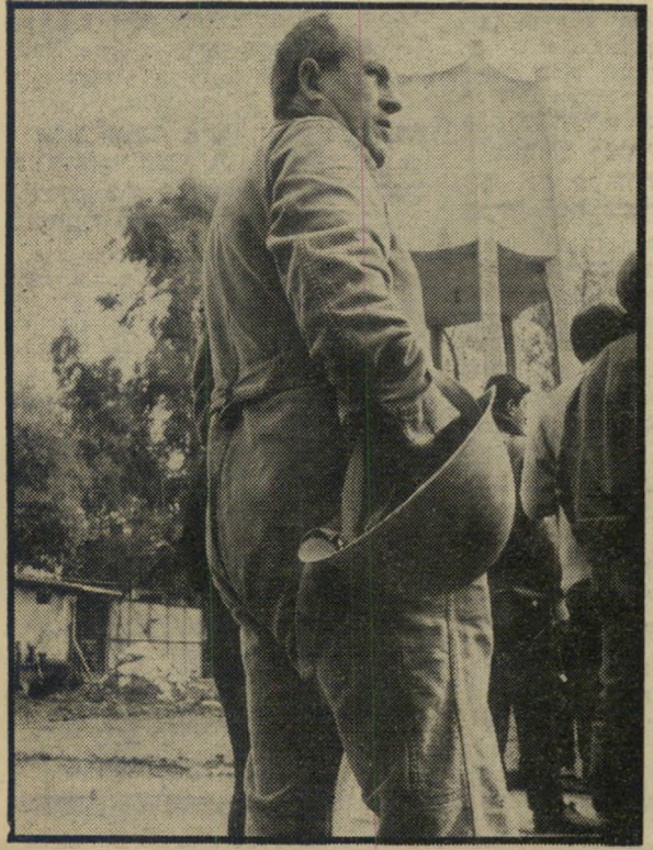
אנשי ספר: אחד מאנשי המשק בין ההפגזות — עדיין בקו האש