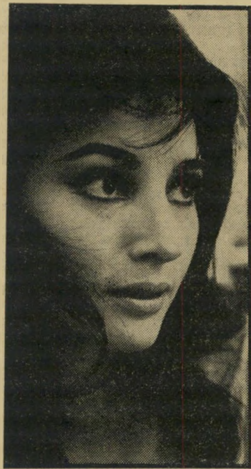
לאה'לה הגרמניה בכל מקום, מקומית

הוא השיג את כל האישורים, ועדיין היה חסר לו כסף, משום שאחד המשקיעים הת-