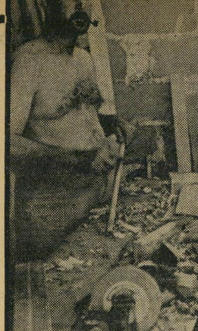
The twisted mind of the murderer above, couldn't comprehend why the innocent girl, r., had refused to accept the money he'd offered her. The stranger weakened his havoc when women refused to date him—rape and death were his revenge!

The police didn't really need a national crisis to find the one clue they required to solve the sex-slaying mystery of the teen-ager—but it sure helped!