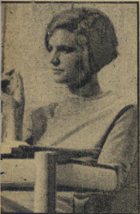
חברת-פרלמנט פיא דאמי אחוד-החסימה לא הועיל

מסוף-הפצצות האטומי, אשר חיל-האוויר האמריקאי איבד מעל לחלק משטחה של דניה (העולם הזה 1587), בא כמתחיל-אלוהים