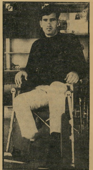
נאשם ביטון לטיפות בשדות

"הסתכלנו זה על זה. צחקנו ביחד. היא שאלה אותי איפה אני שוכב. אמרתי לה.