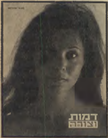
שער ספרו של מרום

קיבוצים. רוב התמונות הן של תירצה ארבל. גרוע מזה: התמונות היפות ביותר באלבום זה, הן דווקא איתן התמונות שפורסמו בסידרת העולם הזה. כי גם אנחנו פירסמנו את תמונותיו של פטר מירום. איך הגיב הקיבוץ על פירסום זה של הטוב בצלמיו?