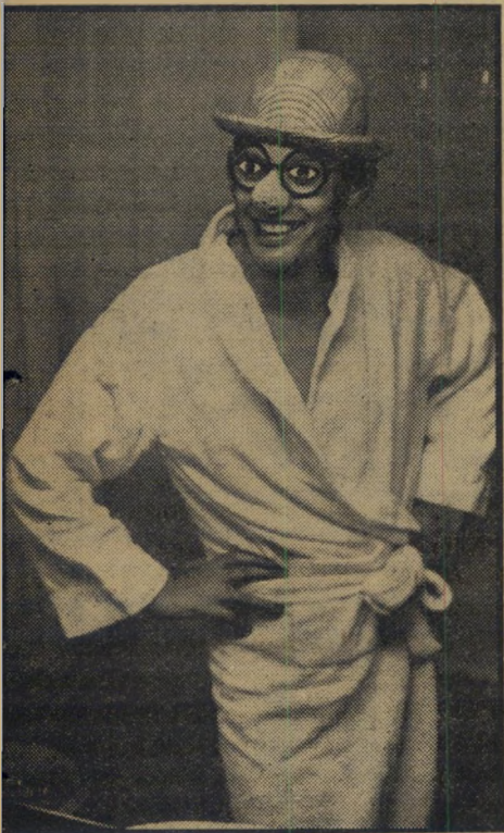
ליצן עם לב רופא שיניים נורמאלי

מדוע לא הלך לוי אשכול להלחית פולחן בגוריון? הסיבה האמיתית נש-תמרה בסוד, נתגלתה במיקרה - שעה ש-ראשהממשלה התודה בפני שניים מאנשי משרדו, בשיחה פרטית: "כשהגיע אלי ה-ידיעה שפולה הלכה, היה ברור שאבוא ל-הלווייה. רק אחרי-כך ניהלתי שיחה עם מרים, ששיכנעה אותי שזה יהיה מסוכן מדי." מסתבר ש מרים אשכול לא התכוננה ל-סכנה ביטחונית, אלא דחקה לזעמו של ה-זקן משדה-בוקר. ● לעומת זאת, הוכיח אשכול כי קרא את אשר אמר דויד בן-גוריון על רעייתו, מייד אחר פטירתה. מוכיחת מפא"י, גולדה מאיר , גילתה ה-שבוע שכאשר שוחח איתה ראשהממשלה, הוא ניסה לשכנעה לקבל מינוי כמוכירת מע"י, בהשתמשו באותו פסוק עצמו: "לכתך אחרי במידבר, בארץ לא ורועה..." גולדה השתכנעה, כפי שמסתבר, מן הגניבה הספ-רותית, הסכימה בסיכומו של דבר. ● אחר ששוכנע, היה הפרופסור כרישטיאן