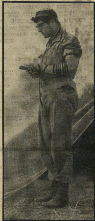
הוא סירב להשתמש

שיחרור נימשך. אלא שלחלמיני הישיבות הסתבר כי הם נמצאים בתוך כלוב סגור, כי ברגע בו היו עוזבים את הישיבה — היו חייבים להתגייס, כמו כל אזרח אחר.