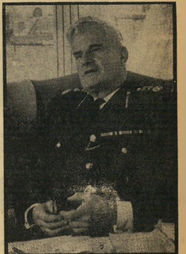
מפקח ראשי סימפסון לחכמים בלילה, מחשבות מבריקות

קודם כל - ההגייה הבלתי-פוסקת מ-שרידי האימפריה ומן המדינות הקשורות, בבריטניה בחבר העמים. פאקיסטנים, כושים, בני איי-טרינידאד ובארבאדוס, וגם קאנאדים,