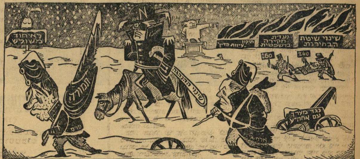
„הנסיגה הגדולה“ (זאב ב, הארץ)

שמה של סיעה הוא נחלת הסיעה כולה. רוב חברי הסיעה מחליט על גורלו. (כך החליטו רוב ח"כי מק"י בכנסת החמישית כי השם שייך לפלג מיקניסי-סנה, ולא לפלג וילנר-טובי.) ההודעה נימסרת על-ידי