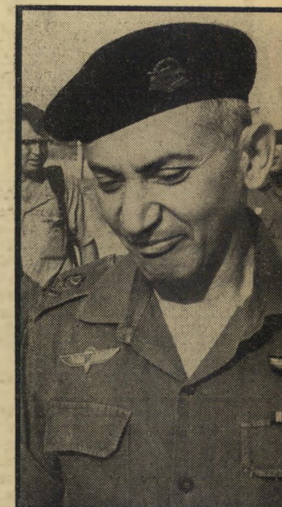
חוקר ברילב תשובה על שאלות

משחתת חילי-הים הישראלי איתן טבעה השבוע בפעם השנייה.