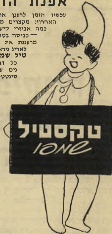
תוצרת ביח"ר נקה המפיצים חב' נורית בע"מ

עכשיו הזמן לרענן את בגדי החורף האחרון: מקצרים מכפלת, מוסיפים כמה אביזרי קישוט — והעיקר — כביסה בטקסטיל שמפו — מרעננת את הצבעים ונותנת לאריג מראה חדש. טקס-טיל שמפו — לכביסת כל זבדי צמר, אריגים עדינים, ואריגים סינטטיים.