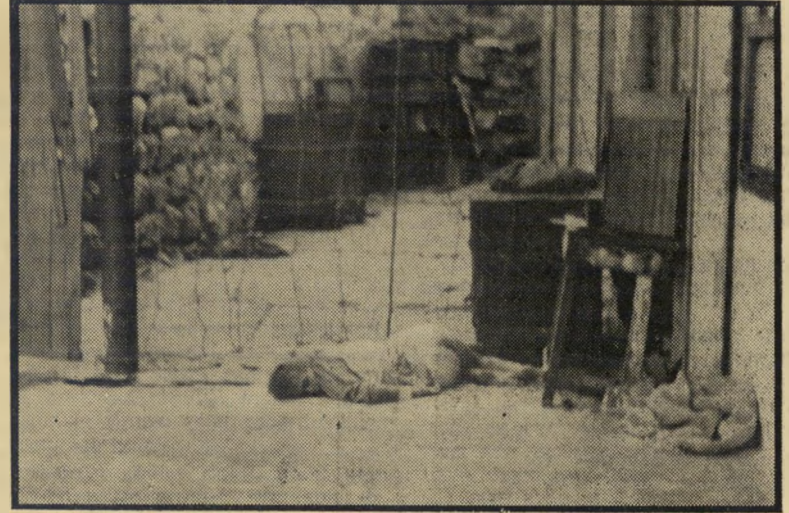
עאטף כמותה (בשוק חברון) — שהלב כאב לי!"

"אנחנו שתקנו. המשכתי לחתוך אותה. פתאום היא התחילה לנוו ולצוק ולצרוח כמו פרה ששוחטים. "סתמתי לה את הפה שלא תעשה רעש כדי שלא יתפסו אותנו. אחרי כמה רגעים היא כבר שתקה. "היא היתה מתה. "בערב חזרתי למקום איפה שהיא היתה שוכבת מתה. עטפתי אותה בניילון, וזרקתי את הגופה שלה ליד השוק. רצייתי שימצאו אותה ויעשו לה קבר."