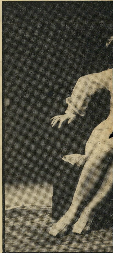
זאת ניבנו סביב אישיותה. בהצגתה האחרונה, קדחת כאן היא נראית עם מחזרה בהצגה, יאיר קלינגר.