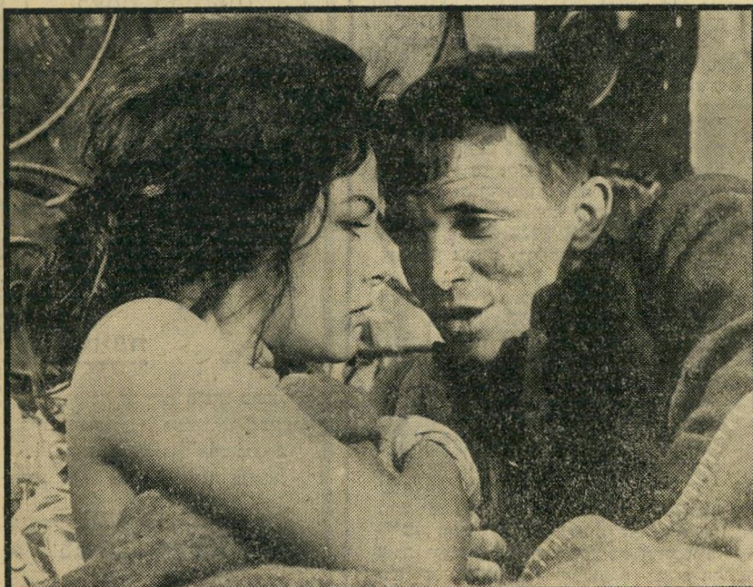
4. הנערה והגנרל (איטליה)