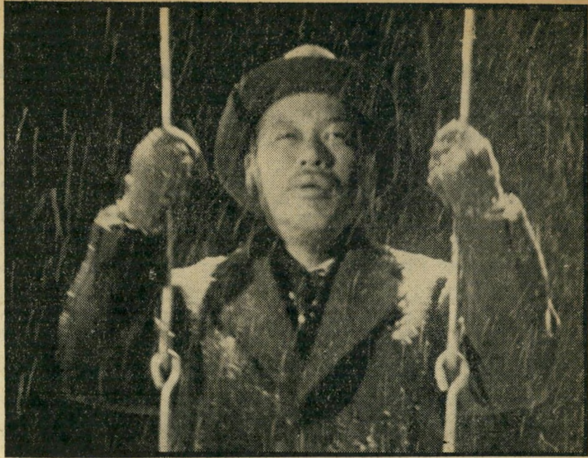
3. אדם וגורלו (יפאן)