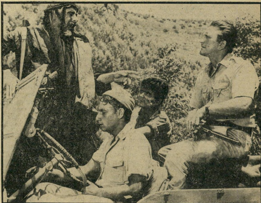
3. הטל צל ענק (ארה"ב)