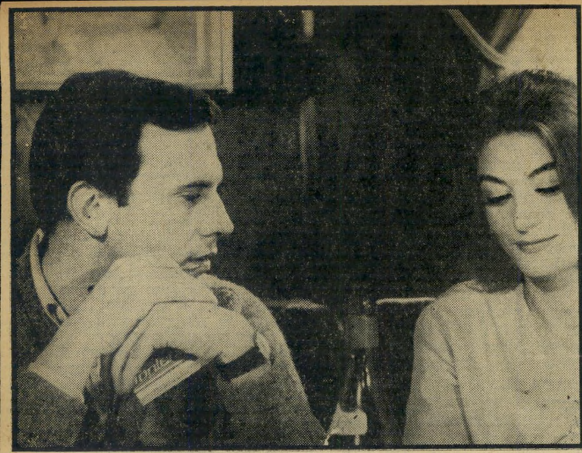
2. גבר ואשה (צרפת)