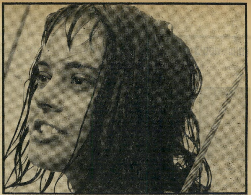
1. סכין במים (פולין)