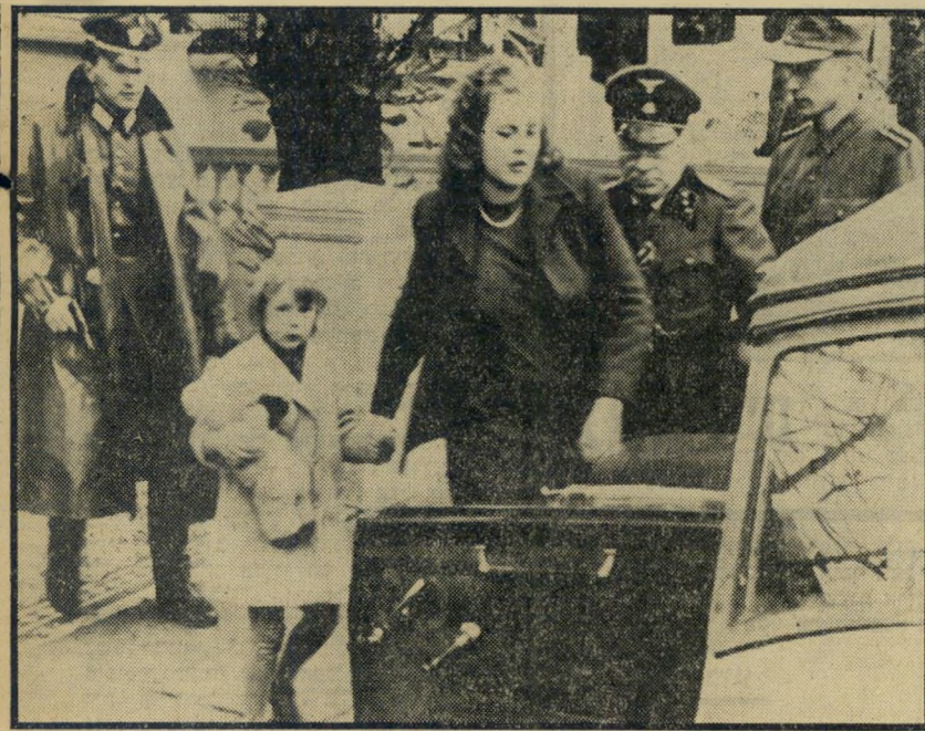
2. זה קרה כאן (אנגליה)