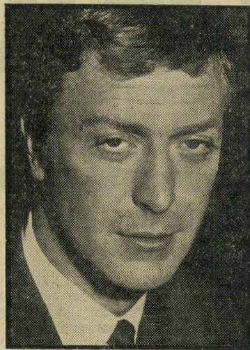
שחקן השנה מייקל קיין "אלמי"

פליני חזר ארצה עם ז'ולייטה והרוז'ה , ניתוח גאוני שנשמחה של אשה נבגרת, ואלן רנה, אורח גדיר, הופיע כאן פעמיים: פעם עם מוריאלי , סיפורם של שני אנשים מזדקנים שבימי צעירותם לא הצליחו לחיות כראוי איש עם רעותו והם מנסים לחזור לעבר הזה, כדי להימלט מן ההווה; ופעם עם המלחמה נגמרה , סיפורו של