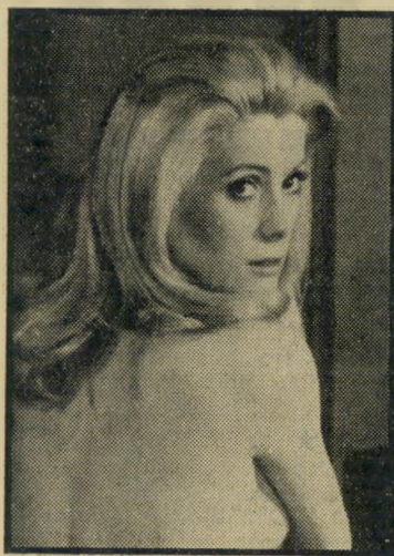
שחקנית השנה קתרין דנב "הדחייה"

מהפכן ותיק, מזדקן ועייף, הלוחם מזה עשרים שנה את מלחמת ספרד הרפובליקאית, ואינו יודע כבר למה, לשם מה. היתה כאן ממש אורגייה גדולה לחובבי הסרט הטוב. אפשר היה לראות ארתור גודל ואמיתי, בכיכוב לורנס אוליבייה, ואפשר היה לראות ריצ'ארד השלישי באותו כיכוב.