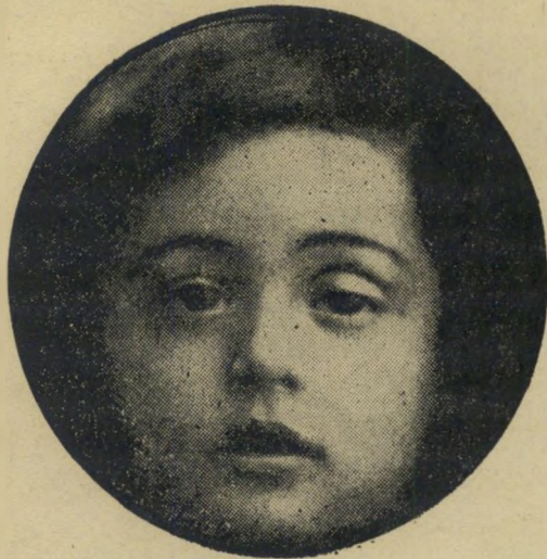
משה דיין בגיל 3

אחרי שאגמר את בית-הספר העממי, הלך ללמוד בבית-הספר התיכון חקלאי שבכניסה למושב נהלל. זוהי עובדה מוזרה כשלעצמה — כי היה זה בית-ספר לבנות, ומשה דיין היה התלמיד-הזכר היחיד בו. כל שאר בני-הסביבה הלכו ללמוד בבית-ספר כדורי הסמוד, כמו יגאל אלון. אין זה רגיל לנוער מתבגר להסכים ללמוד בבית-ספר לבנות. מתי חל השינוי הגדול באופיו של הנער? כנראה סמוך לתקופה בה ביקר בבית-ספר זה.