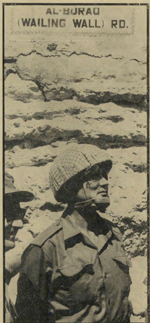
דיון בדרך אל הכותל המערבי

לכאורה, היה משה דיון צריך להתגאות בכיסוי זה, המזכיר את שרתו הארוך למולדת. אולם דיון סובל מן הכיסוי, גם גופנית וגם נפשית.