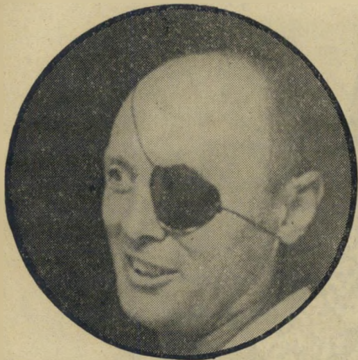
ההבעה הרגילה: חיך ללא עליזות

מתליט, לעיתים קרובות, את החיפך. החלפני תינו מצטרפות לפסיפס של חוסר-החלטה, של זינזאגים חפרישיטה, שהוא לפעמים גרוע בהרבה מהספנות פשוטה.