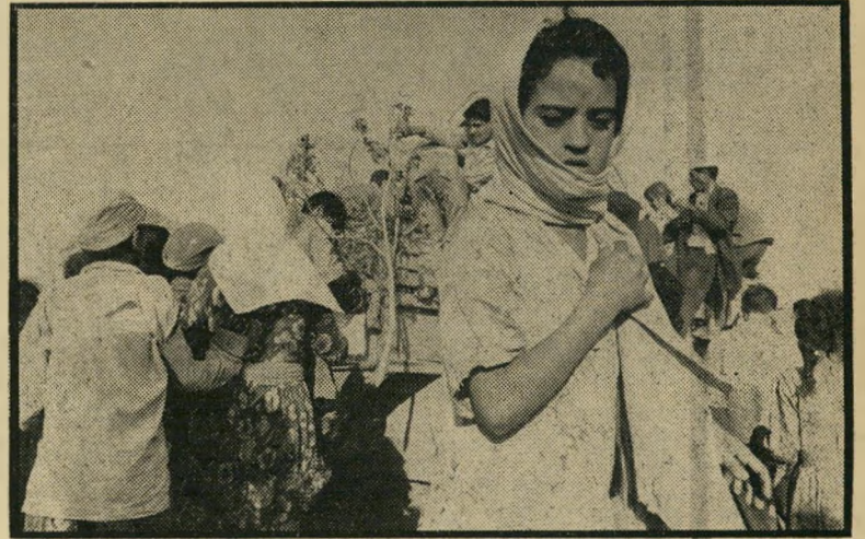
ילדי רפיח ומכונת האשפה

בימים האחרונים דובר בעיתונות על הק-מת התנועה הערבית למען מדינה פלשתי-נאית עצמאית. זו הודמנות יוצאת מגדר הרגיל להביא לידי פתרון טוב לבעייה כאובה זו. אך חובה עלינו שלא להתערב, בינתיים, במאמציה של תנועה זו, לא לטובה ולא לרעה, לא מצד הממשלה ולא מצד מפלגות כגון הכוח החדש. תמיכת אבנרי בתוכנית תשניא אותו על יתר המפלגות. תמיכת הממשלה התפוך את