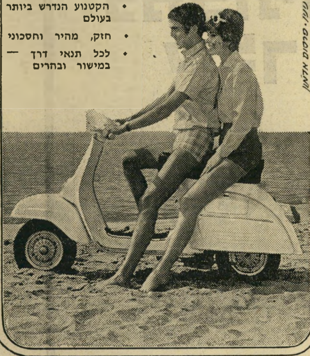
טען, סוסים אדון