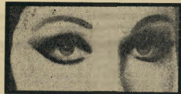
איפור נוסח טוויגי

אבל פאריס. ש-היתה פעם המחדית, ושהפכה בינתיים לשנייה במעלה אחר קארנבי סטריט — ובכל זאת נשארה ראשונה ל-טעם הסוב, אימצה, בינתיים, את המראה של הבריטית בת ה-17, יצרה אפילו „בובות טוויגי“ מ-פלסטיק כדי להקל על המעוניינות לביצע חיקוי מושלם. אל תתפלאו אם הישראליות המתחילות לזרום ארצה, בחזרה מן החופשות