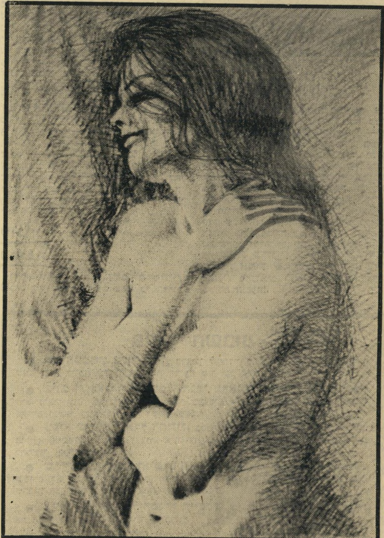
הנשואה היא תמונתו האחרונה של הצייר. המצוירת היתה בטוחה שירם מזמין אותה לשבת עירום כתיורן, נעלבה קשות כאשר הוא החל לצייר אותה במקום לפנול. תגובתה המיידית: היא פרצה בבכי מר, אספה את בגדיה, התלבשה וברחה.