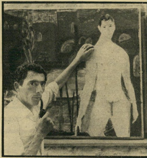
בנימינו וציור עצמי שדו

הוא ממש בכה. בסוף עשיתי לו טובה ודרשתי ממנו דמי-קדימה בסך 30 אלף לירות. התייר שילם. אז הוברר לאמריקאי שרימתי אותו. הוא שכר בלשים פרטיים, והם הגיעו למשפחתי. היה מו"מ - בסוף התפשר