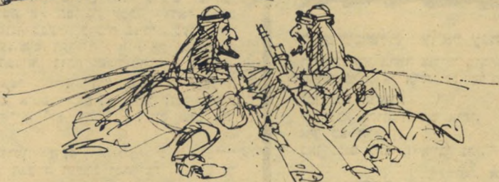
"נאצר אמר שזה בזוף!"