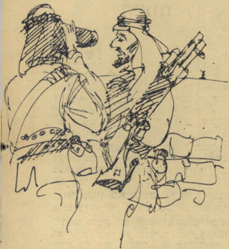
"מעניין, הוא לא נראה כמו יהודי"

ששום תלמיד אינו יכול לתפוס מקום ב"חברה על סמך הידיעות שהוא ירכוש מספרים אלה." שלא לדבר על מחיקת פרקים שלמים של ההיסטוריה והתרבות הערבית, והחלפתם בהיסטוריה ציונית.