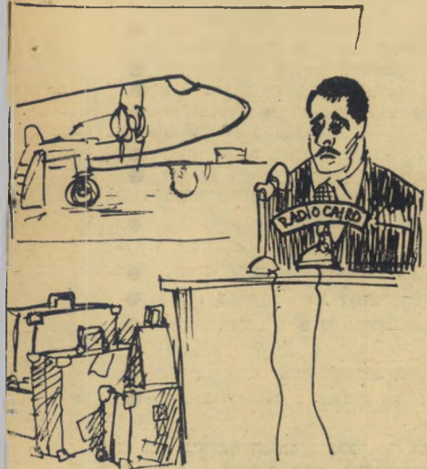
"אני בטוח בהחלט בנצחוננו!"

בהקדמה לסיפרם שוכה בשם הדרך ל"טואץ (או: משהו מוזר אירע בדרך לקאהיר)