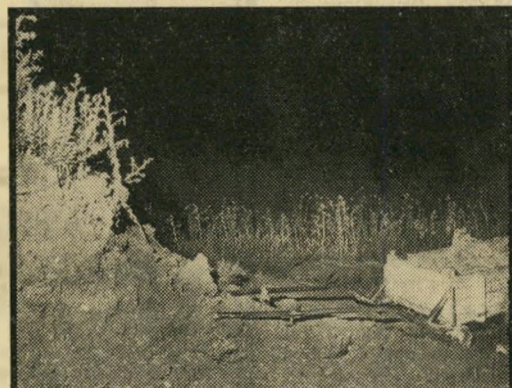
כאן ביצעו החוטפים את זממם

הצעירה החלה להתחנן, ופרצה בכי מר. בעברית וברבית, השגורה בפיה, ביקשה מן האנסים שירפו ממנה. הם ענו לה - דחקא בעברית צחה, מתובלת בקללות מיוזרות עסיסיות. תוך-כדי גידוף, הוסיפו להיאבק איתה. אין ספק שהיו מבצעים בה את זממם כבר שם - אלא שכאן התערב המיקרה. 9:25: כלב-שמירה בחזה פרטית, הנמצאת במרחק-מה מן המיזבלה, התעורר נוכח הקולות הבוקעים מן הסנדר - והחל לנבוח. השניים נבהלו והתניעו את המנוע.