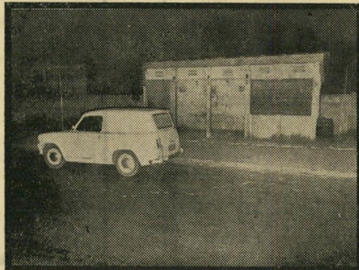
כאן חיכתה הצעירה לטרמפ

רשהתעורר פושר מתדרמתו המעשית והמיקצועית. הוא פעל במהירות - והורה להטיל איפול מוחלט על המיקרה. פרט להודעה לעיתונות, נאסר על כל תחנות-המשטרה באיזור לקיים קשר עם איש מן החוף ולמסור פרט כלשהו על המיקרה. שוטרי-הנפה אף הוזהרו שלא לדבר עם נשותיהם על האונס. כך הפסידה משטרת-עכו עוד הזדמנות אחת: היא לא גייסה את עזרת הציבור - שהיא, אולי, המקור היחיד לידעויות, במיקרה כזה. אילו גויסה כל העיתונות ונעשה פומבי בציבור על אופיים המסוכן של שני מטורפי-המין, המסוגלים לבצע שוב ושוב מעשי-אונס אכזריים - יתכן שהיו מאתרים כבר את פושעי-המין. נראה שהמשטרה התייאשה מלגלות, למעשה, את האנסים: גם ביום הרביעי אחרי המיקרה, עדיין לא הובאו פירטי-האנסים אל הקלסטרון, עדיין לא פורסמה תמונת-דגם, שי תעזור לזהות את הפושעים. דבר זה, אותו הבינו כל אלה ששמעו את פירטי-החקירה - או איה-החקירה - הוחחר גם לניצב אהרון סלע, מפקד המחוז הצפוני של משטרת ישראל, סלע, הוועם על טיפול פקודיו במיקרה, ציחה על ניצבי-מישנה מנחם בנדל, ראש ענף חקירות במחוז הצפוני, לקבל את החקירה לידי.