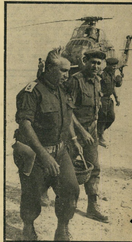
אריק שרון (בתום המלחמה) הוא שמע ארוכות, אך דיבר קצרות

קומנדו במקרר . הקורבנות הראשונים של מלחמת-הבוק היו 12 פרות ברפת של