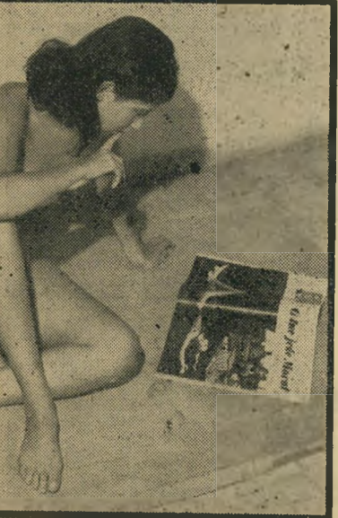
"בלי כל מוסר", כתוב ב-חובות, אי-אפשר. אך לדעתה: לגמרי בלי מוסר — אי-אפשר.

"אני אוהבת בני-אדם — אבל אני נשמרת מפניהם. אני אוהבת גברים — אבל איני מו-