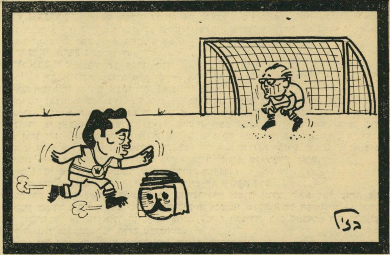
הפליטים בין שני עברי הירדן

המדינה התלבטה. סעיף א': הפליטים. היא התלבטה ביחס לפליטים. ישראל הבטיחה להחזיר אר- הם מעבר-הירדן - לפני שידעה כי מספרם מגיע לרבע מיליון. עתה גבר הרצון להתחמק ממילוי הבטחה זו. בשביל מה להכניס עוד ערבים לשטחים המוחזקים? גם התירוץ נמצא בנפול. המלך דרש מן